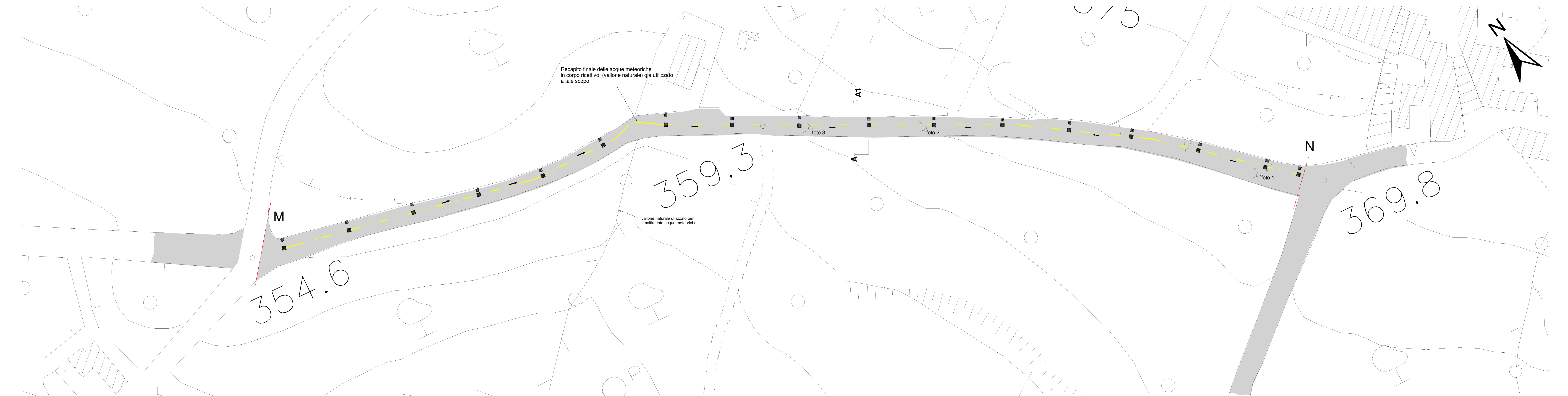
Planimetria Rapp. 1/400 con indicazione del tratto "M-N" oggetto di intervento