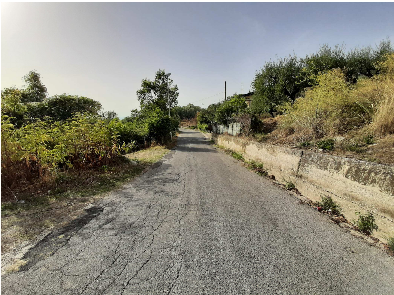
Foto 2 Stato di fatto del Tratto MN visto dal lato est