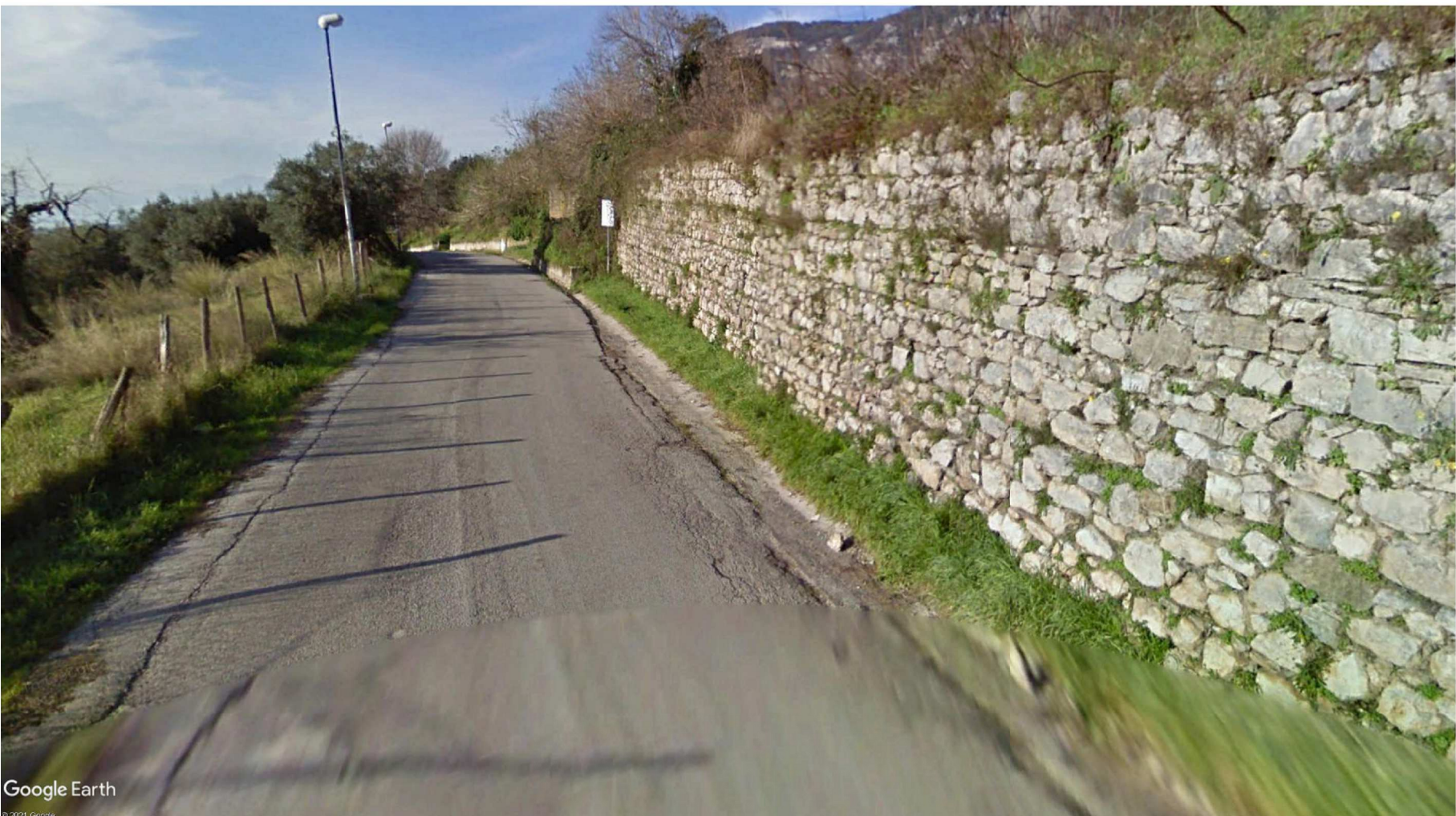
Foto 1 Stato di fatto del Tratto MN visto dal lato est