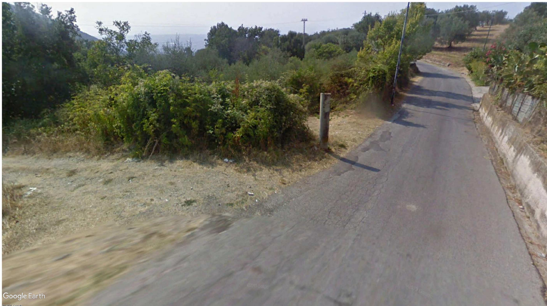
Foto 3 Stato di fatto del Tratto MN visto dal lato est